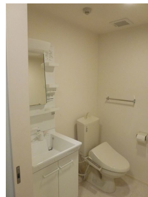
②居室内写真 トイレ