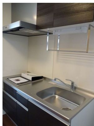
③居室内写真 ミニキッチン