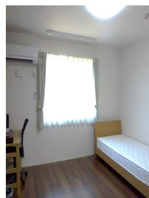
④居室内写真 洋室部分